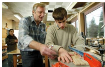
Európske spoločenstvo, 2006

K možným príčinám uvedenej vyššej miery pracovných úrazov a zdravotných problémov patria nedostatočné skúsenosti mladých zamestnancov, ich fyzická a psychická nezrelosť a nedostatočná informovanosť o otázkach týkajúcich sa bezpečnosti a ochrany zdravia a skutočnosť, že zamestnávateľa neposkytujú príslušné informácie o týchto faktoroch, nezabezpečujú dohľad a bezpečnostné opatrenia a neumiestňujú mladých zamestnancov do pracovného prostredia, ktoré je pre nich vhodné. Je potrebné vážne pristupovať k pracovným rizikám, ktorým sú vystavení mladí za-